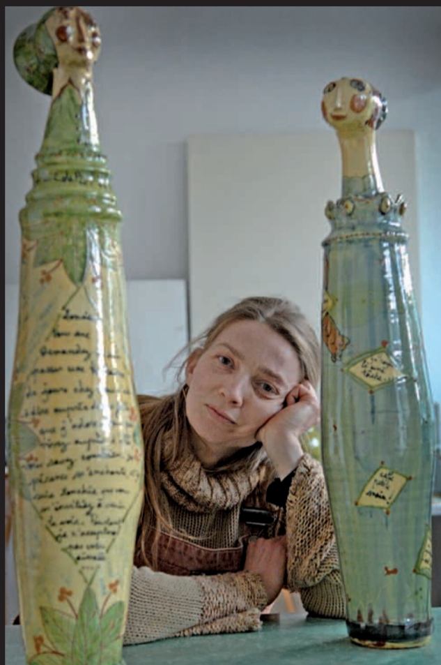
tête de l'art