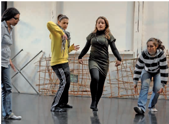
Neuf animatrices suivent un tutorat de formation auprès de la Compagnie de danse Myriam Dooge. Des participantes, qui ont déjà une pratique de la danse : tzigane, africaine, hip-hop, ou asiatique et acquièrent ici de nouveaux outils pédagogiques. Mercredi 8 avril, elles présenteront aux danseuses de la compagnie les chorégraphies en cours de création avec les enfants. Un regard à mi-parcours avant un spectacle en juin.

À quelques pas de là, c'est par une représentation au public que com-