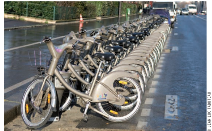
Quel système pour compléter Velib' ?