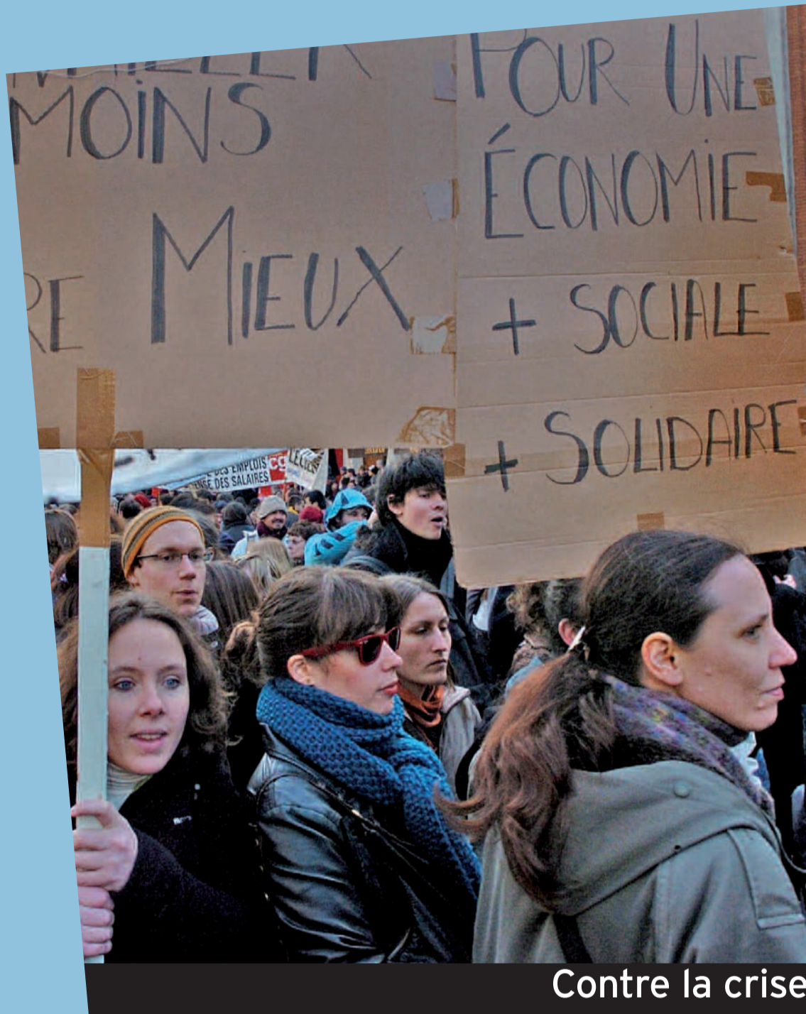
Contre la crise