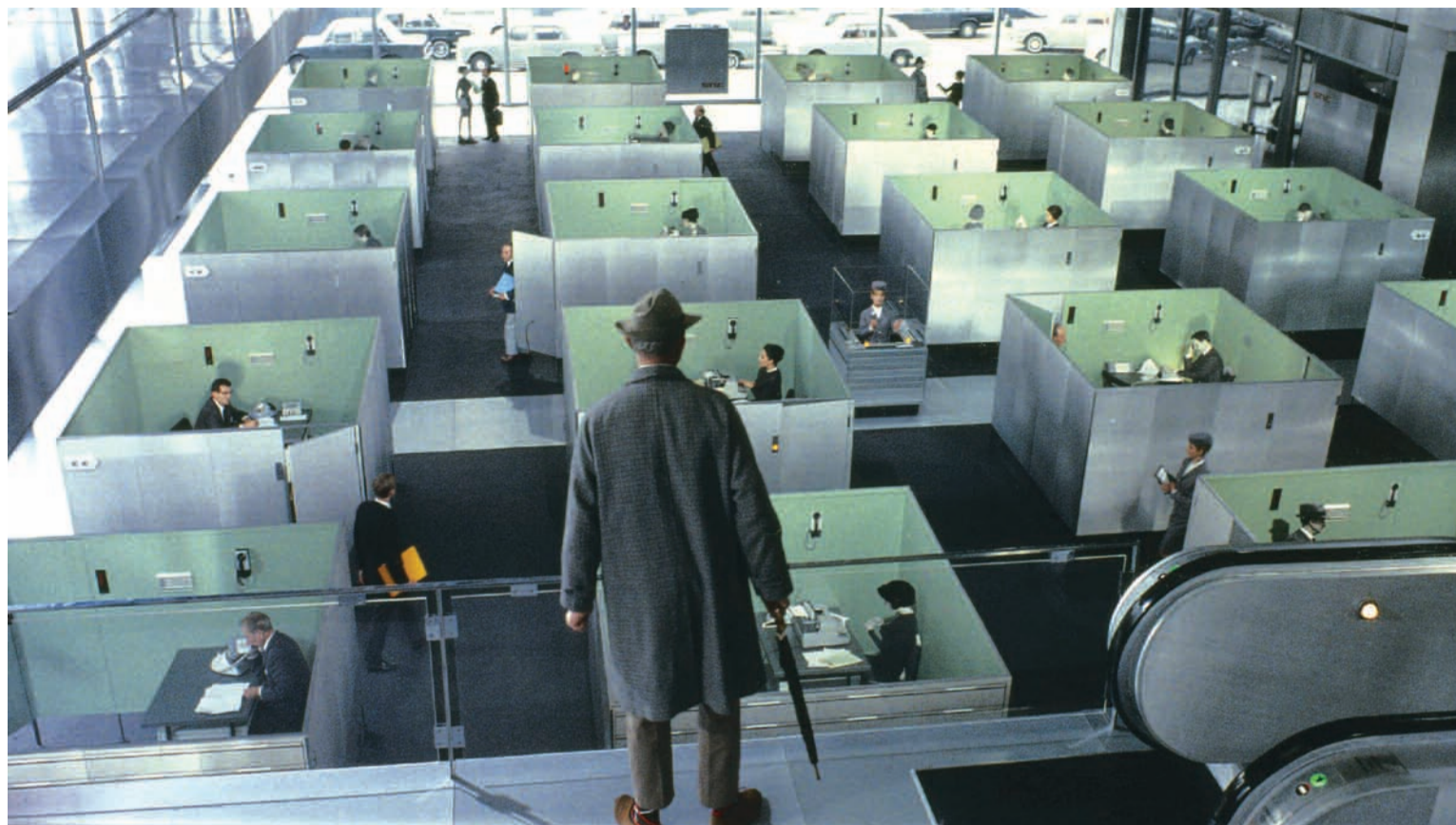
Monsieur Hulot surplombe le labyrinthe de Playtime , 1967.