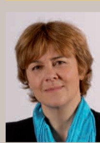
Dominique Voynet Maire de Montreuil Sénatrice de Seine-Saint-Denis

A vec l'arrestation à Montreuil du « violeur de l'Est parisien », les familles sont soulagées, les enseignants et les éducateurs aussi.