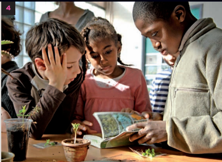
4 ◀ Créer un potager, fabriquer une fusée volante... Des associations spécialisées interviennent dans les centres pour des activités de science et technique, ou d'éducation à l'environnement.